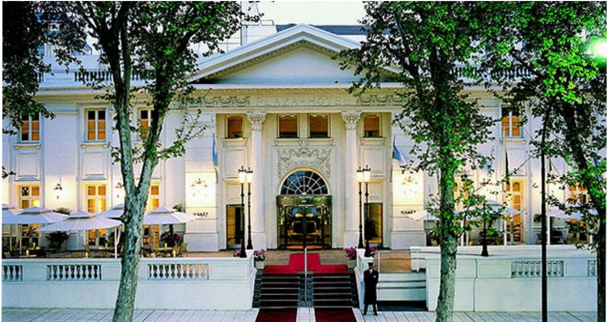
Hotel Park Hyatt Mendoza

Vi checker ind på det flotte Park Hyatt Mendoza ***** www.mendoza.park.hyatt.com . Aftenen er fri. Man kan spise middag i hotellets dejlige gårdhave eller ude i byen.